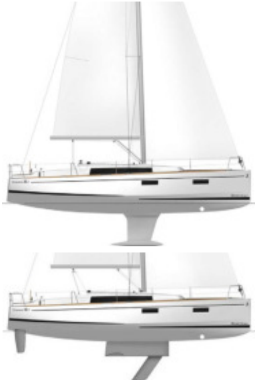
Schwertboot - Option: Bogen