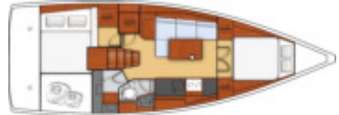
- Version mit 3 Kabinen