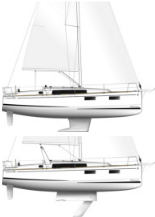
Schwertboot - Option: Bogen